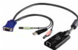
USB虚拟媒体电脑端模块 +音频功能 KA7176 x 14