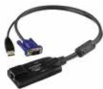
USB电脑端模块 KA7570 x 8