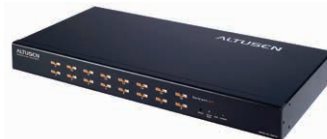
16端口Serial Console Server串口控制台服务器 SN0116 x 1