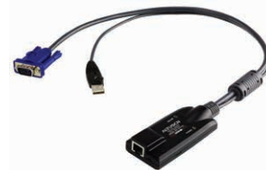
USB虚拟媒体 电脑端模块 KA7175 x 92