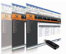
Control Center Over the NET™管理软件 CC2000 x 1