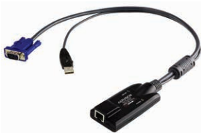
USB虚拟媒体电脑端模块 KA7175 x 128